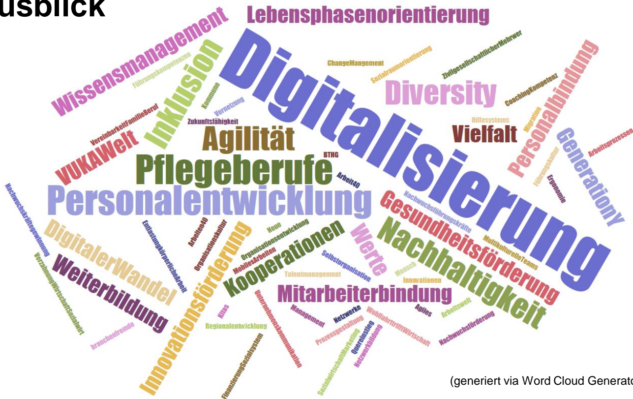
(generiert via Word Cloud Generator, www.jasondavies.com/wordcloud )